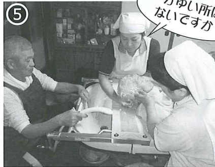
⑤ 髪を洗ってから湯ぶねに入ります。