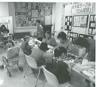
体験・紹介・販売コーナー