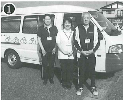
① 看護師・介護員の3人で訪問します。