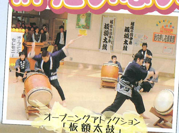
オープニングアトラクション 「板額太鼓」