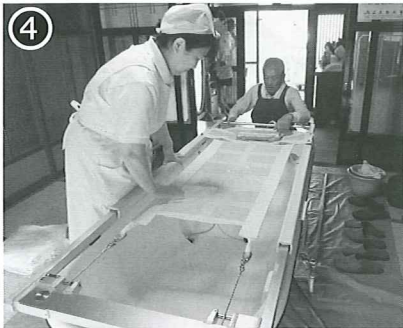
④ 給水や排水などの準備をします。