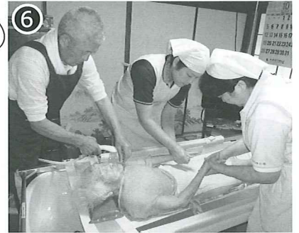
⑥ お湯の中で身体を洗ったら、シャワーを掛けて流します。