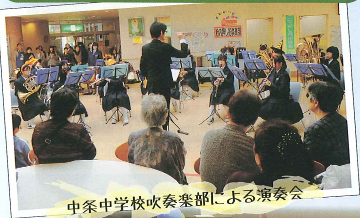
中条中学校吹奏楽部による演奏会