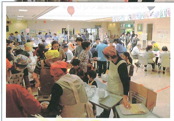
おしるこ振る舞い