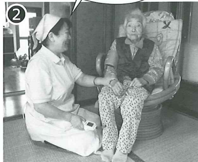
② 入浴前に看護師が体調を確認します。