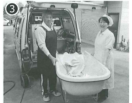
③ 浴槽をお部屋に運びます。