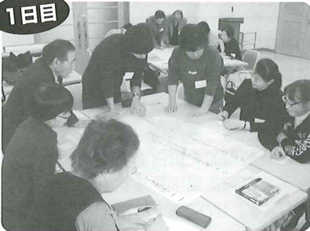
参加者が思い描く、近隣たすけあいについてのワークショップ