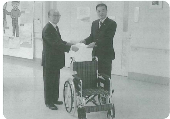
連合胎内支部より車椅子の寄贈がありました。必要な方に貸出しをして、多くの市民の方に使っていただけます。