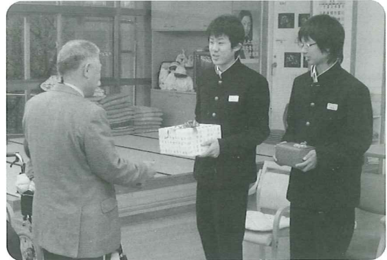
黒川中学校生徒会の代表からアルミ缶回収の収益金で、いわはら荘にフォトプリンターが贈呈されました。利用者のたくさんの笑顔をプリントします。