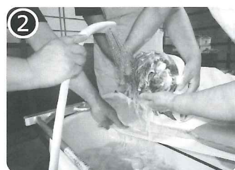
② 最初に髪を洗ってさっぱり