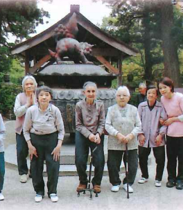
乙室寺で記念撮影