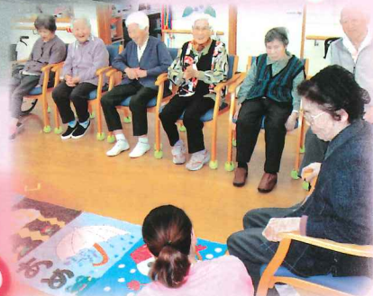
明日天気にな〜れゲームで足の運動