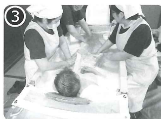
③ 足を伸ばしゆったり