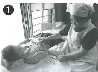
① 血圧測定で体調を確認

※タオル・バスタオルを持参していますので、雨の多いこれからの季節、洗濯物の心配はありません。