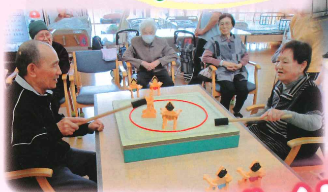
相撲ゲームで腕の運動