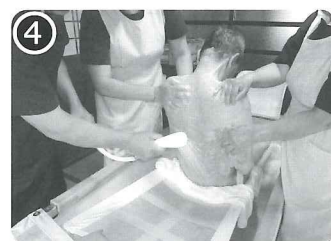
④ 身体を洗って気分爽快