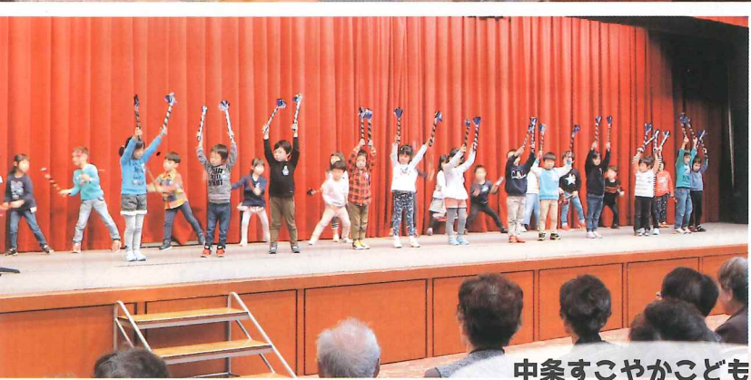
中条すこやかこども園の 年長児さん