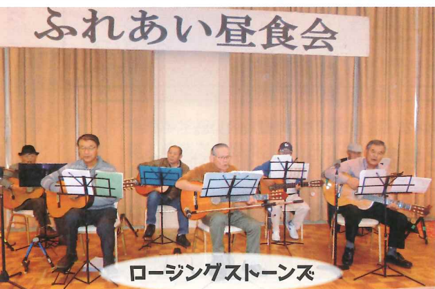
ロージングストーンズ