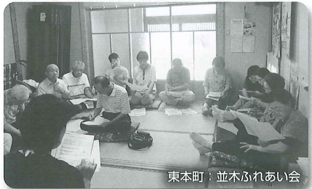
東本町：並木ふれあい会