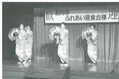
余興 嘉乃会様（新発田市ボランティア）