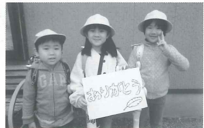
新一年生への防犯ブザー贈呈