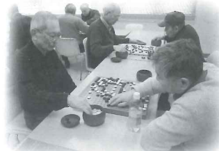
「ほっとHOT中条」でのひとこま 囲碁対戦中!