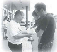
ボランティア活動にも積極的に取り組んでいます

これからやってみみたい方、女性の方、初心者の方も大歓迎です。どうぞお気軽にお問い合わせください。お待ちしております。