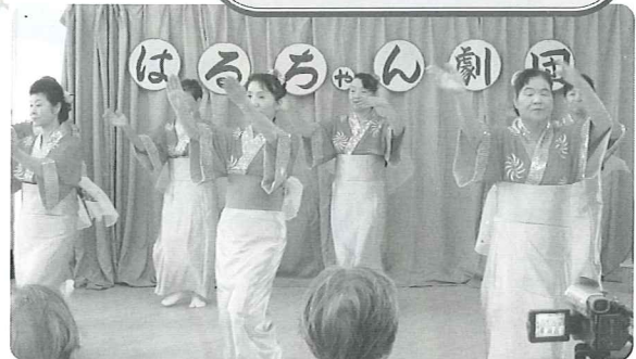
『はるちゃん劇団』による歌と踊りの披露