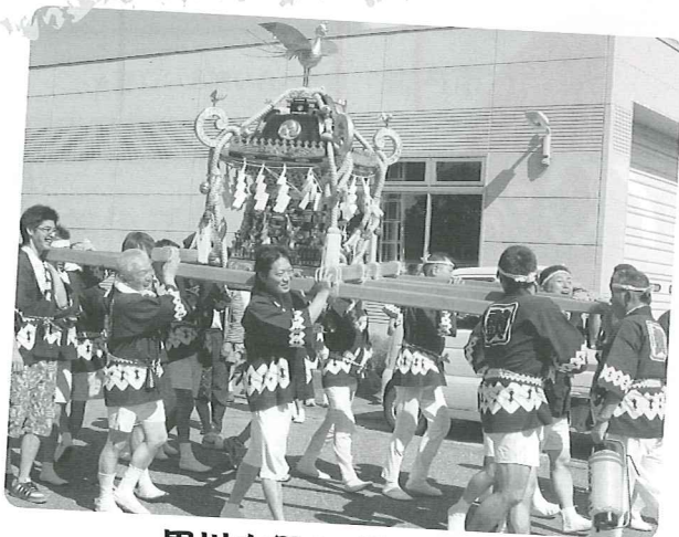
黒川大祭の「御神輿」