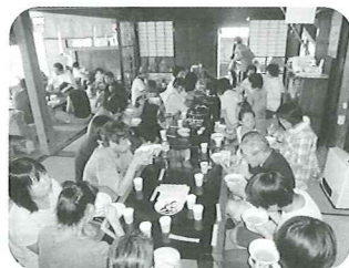
ほのほの茶屋で豚汁がふるまわれました。