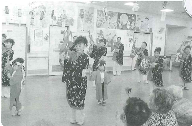
「中条和組」によるよさこいの披露