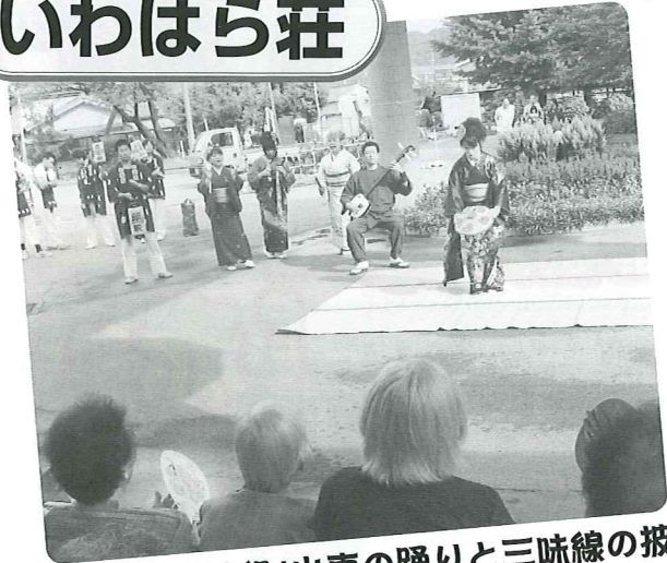
中条大祭「西榮組」山車の踊りと三味線の披露 (ほつとHOT・中条まで出かけて見せてもらいました。)