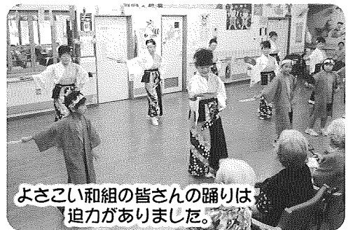
よさこい和組の皆さんの踊りは 迫力がありました。