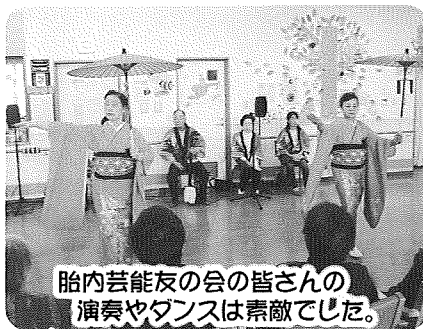
胎内芸能友の会の皆さんの 演奏やダンスは素敵でした。