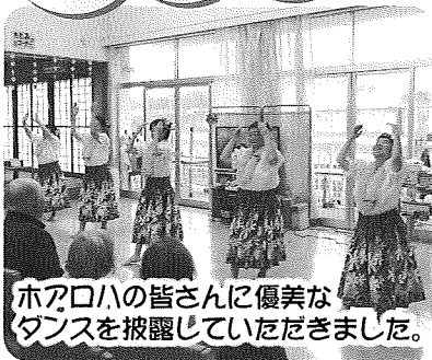
ホアロハの皆さんに優美な ダンスを披露していただきました。

毎月大変多くの方にボランティアに来ていただき、お話や踊り、演奏などを披露していただいております。ご利用者の皆様の笑顔が見られ、楽しい時間を過ごすことができます。