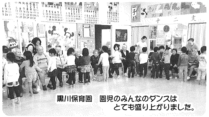
黒川保育園 園児のみんなのダンスは とても盛り上がりました。