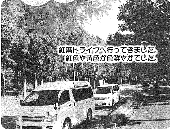
紅葉ドライブへ行ってきました。 紅色や黄色が色鮮やかでした。

毎月、季節に合わせた行事を企画しながらご利用者に喜んでいただいております。お花見、夏祭り、クリスマス会や新年会なども行っています。