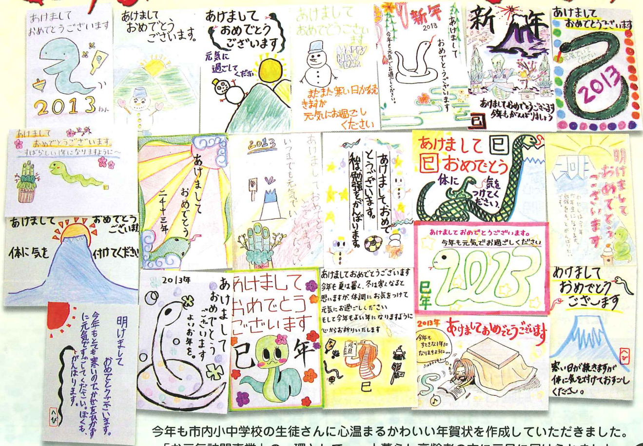
今年も市内小中学校の生徒さんに心温まるかわいい年賀状を作成していただきました。 「お元気訪問事業」の一環として、一人暮らし高齢者の方に元旦に届けられました。

地域の皆さまとのふれあいを大切に、 そして、皆さまに笑顔をお届けできるよう 職員一同努めてまいります。