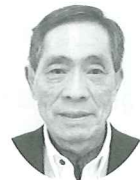
胎内市ボランティアセンター 運営委員長