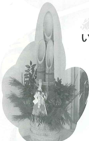
利用者さまのご家族から、いただきました。今年一年、明るさと元気を皆様へ！