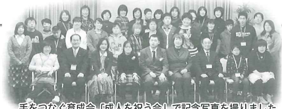
手をつなぐ育成会「成人を祝う会」で記念写真を撮りました (H23.1.23)