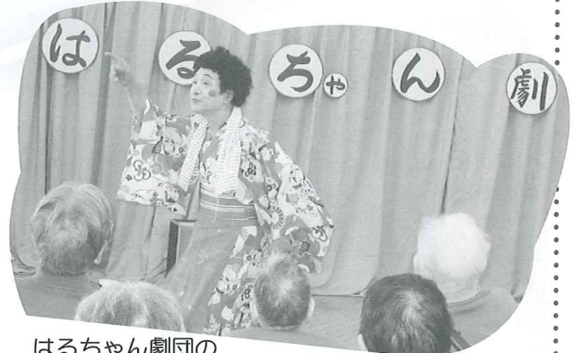
はるちゃん劇団の歌と踊りで、大いに元気をいただきました。(新年会)

皆さまに喜んでいただけるような行事を計画し、楽しい一年を過ごしていきたいと思っています。