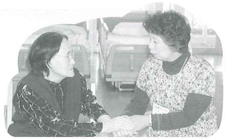
傾聴ボランティアさんが利用者さまのお話をきいてくれています。