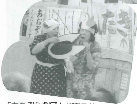
「あおぞら劇団」(新発田市)による演劇と大合唱で、みんな笑顔になりました。(新年会)