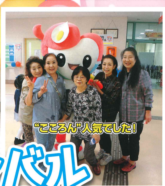
“こころん”人気でした!