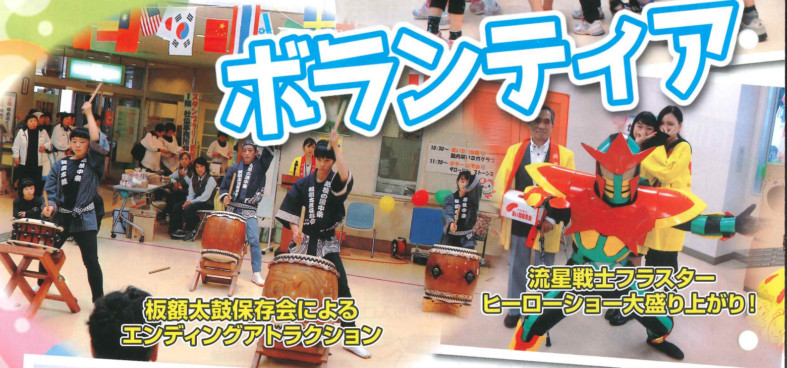
板額太鼓保存会による エンディングアトラクション