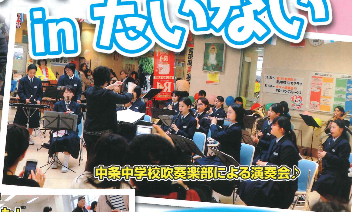
中条中学校吹奏楽部による演奏会♪