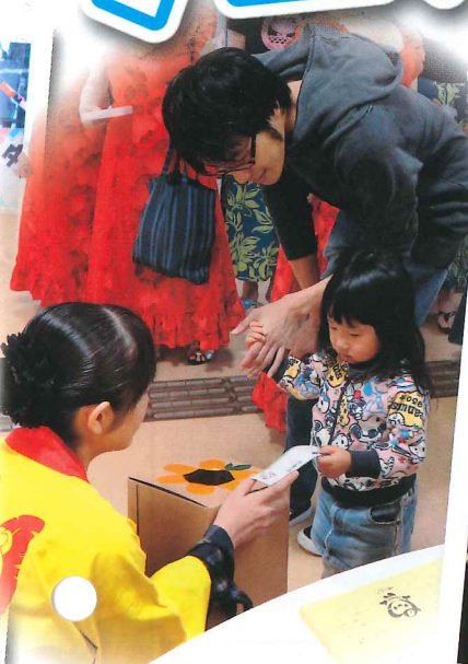
子ども達もいっぱい遊びにきてくれました!