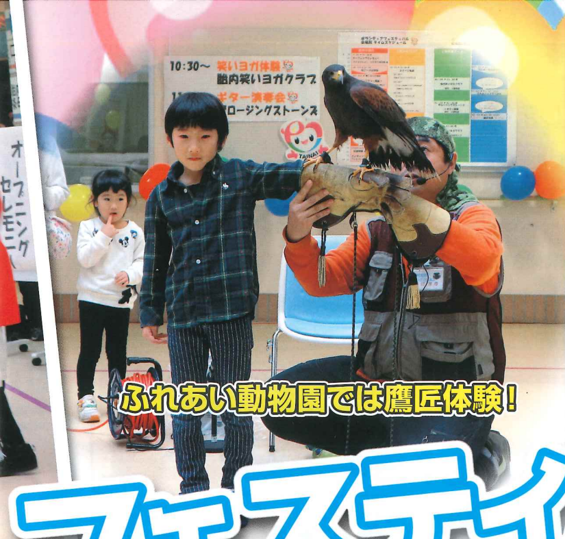
ふれあい動物園では鷹匠体験!