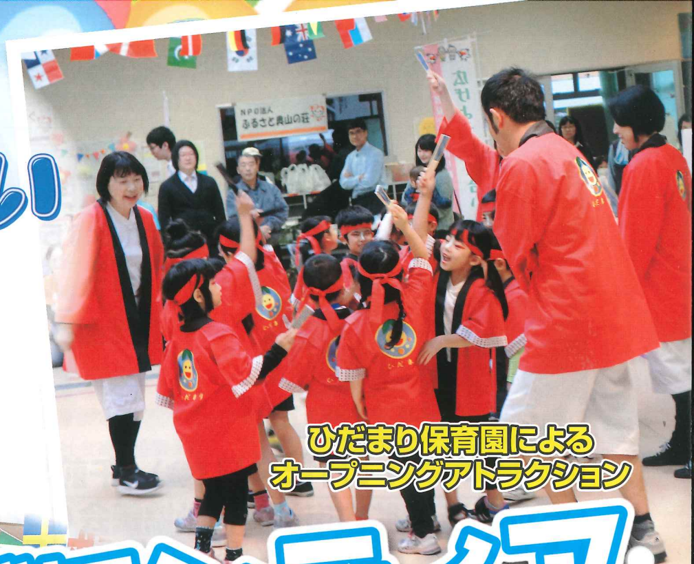
ひだまり保育園による オープニングアトラクション