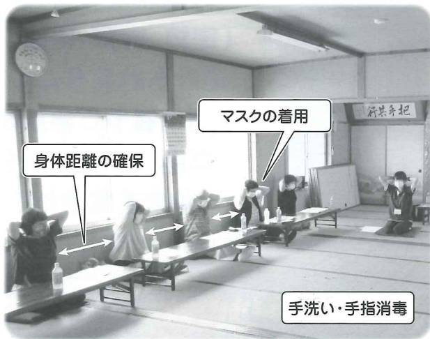
上記写真は、間隔を空けながら座り、話を聞いたり、体操を実施している様子です。