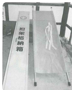
安心・安全なまちづくり支援で防災用品を整備