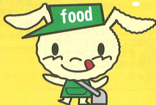
イメージキャラクター：ふーどん