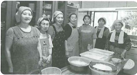
ふれあい会の皆さん

7月23日、平木田駅前ふれあい会では地藏様まつりに合わせて子供会との交流会を行いました。“そうめん流し”の催しで子どもたちは大興奮。ふれあい会の参加者も「賑やかで楽しいね♪」、「子どもたちの顔が見れてうれしい!!」などの声が聞かれました。当日は、地元の有志も準備を手伝い総勢50名以上も集まり、そうめん流しは大成功となりました。