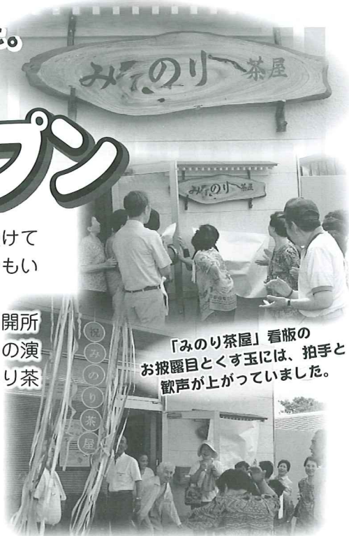
「みのり茶屋」看板のお披露目とくす玉には、拍手と歓声が上がっていました。