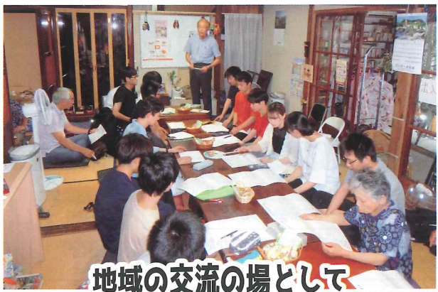
地域の交流の場として