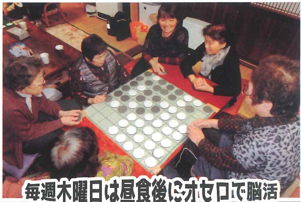
毎週木曜日は昼食後にオセロで脳活