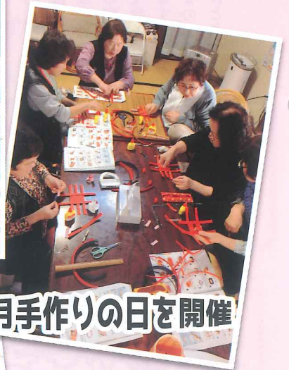
毎月手作りの日を開催