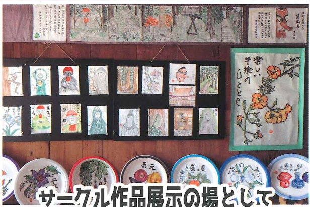
サークル作品展示の場として