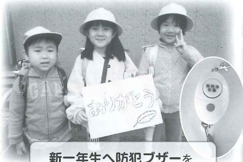
新一年生へ防犯ブザーを 248個贈呈できました