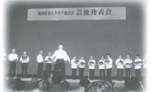
胎内市老人クラブ連合会 芸能発表会