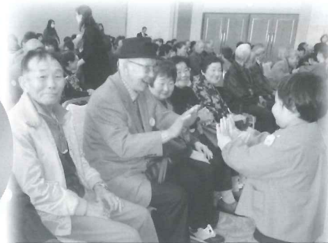
高齢者ふれあい昼食会では参加者と 市内の保育園児との交流ができました