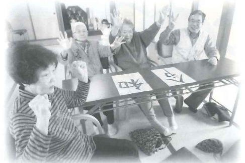
市内42のお茶の間サロンの交流会 や手作り品の材料費などに活用されま した