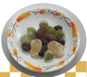
甘～い甘納豆をいただきました♡