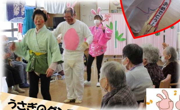
うさぎのダンス♪鑑賞