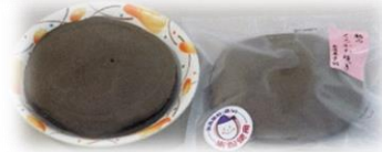
おやつは“くろかわ焼き”をいただきました♡