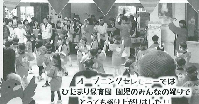
オープニングセレモニーでは ひだまり保育園 園児のみんなの踊りで とっても盛り上がりました!!

おかげをもちまして、盛大に「ボランティアフェスティバル in たいない」を開催できましたことを、ご協力いただいた全ての方々に心よりお礼申し上げます。当日は、晴天に恵まれ沢山の方にご来場いただきました。ひだまり保育園様、中条中学校吹奏楽部の皆様にフェスティバルを盛り上げていただいたほか、市内で活躍するボランティア団体による踊りや演奏などの発表をはじめ、販売や体験コーナーでは大変な賑わいを見せていました。胎内市で活躍するボランティア団体の活動を、市民の皆様にも広く認知される素敵な時間になったのではないのでしょうか。