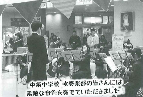
中条中学校 吹奏楽部の皆さんには 素敵な音色を奏でていただきました!