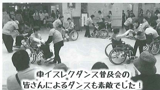
車イスレクダンス普及会の 皆さんによるダンスも素敵でした!