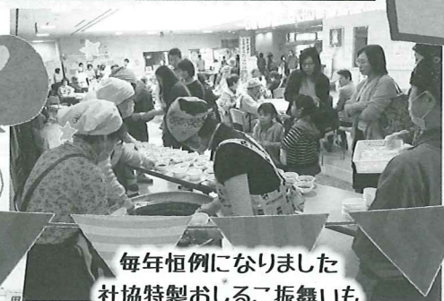
毎年恒例になりました 社協特製おしるこ振舞いも 大盛況でした!