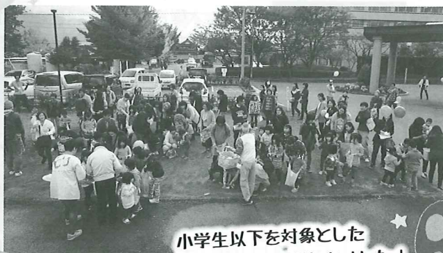
小学生以下を対象とした お菓子まきが盛大に行われました!