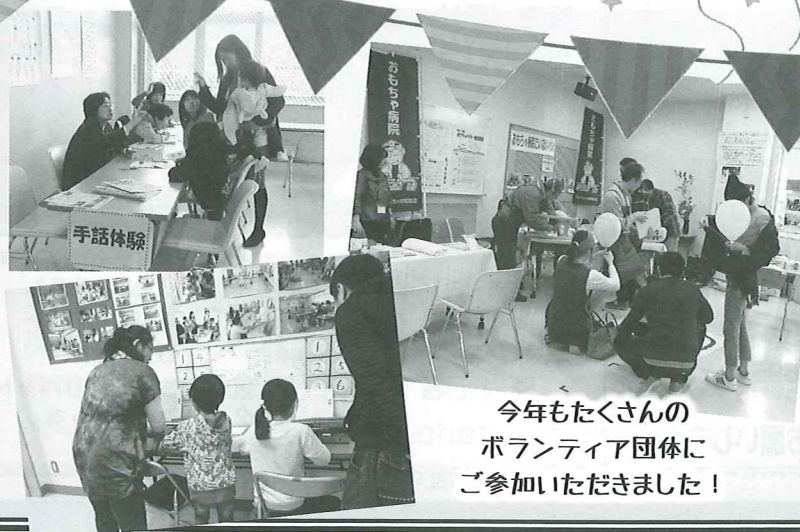
今年もたくさんの ボランティア団体 ご参加いただきました!