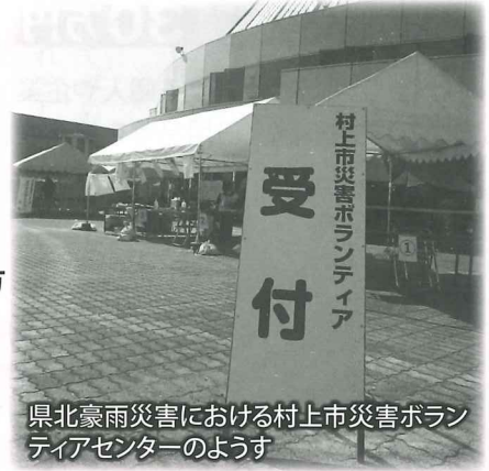
県北豪雨災害における村上市災害ボランティアセンターのようす