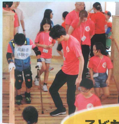
子どもたちへの活動