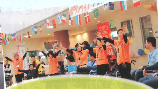
地域福祉・ボランティア に関する活動