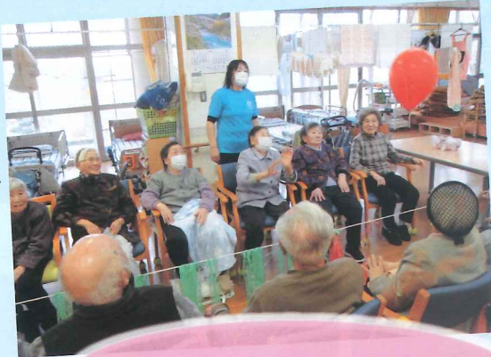
高齢者を支援する活動