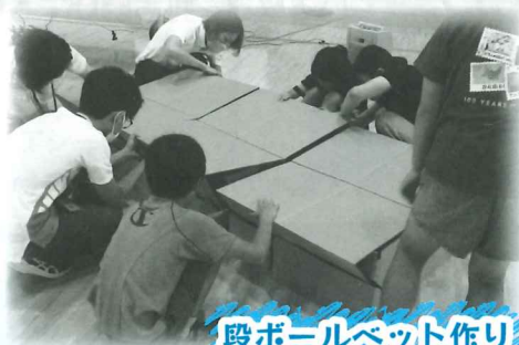
段ボールペット作り