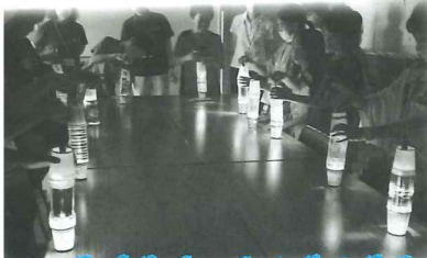
ペットボトルでランタン作り