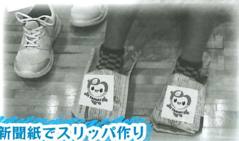
新聞紙でスリッパ作り