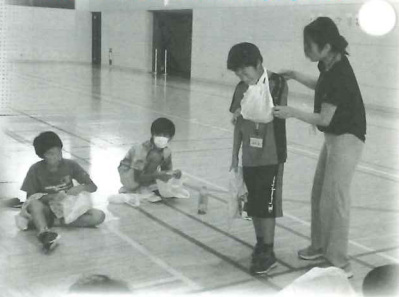
ビニール袋で応急手当