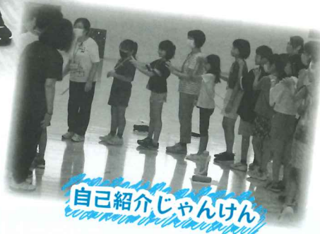
自己紹介じゃんけん