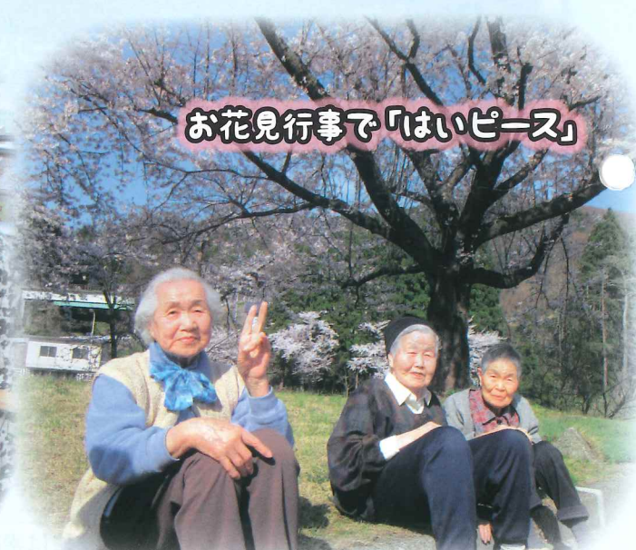
お花見行事で「はいピース」