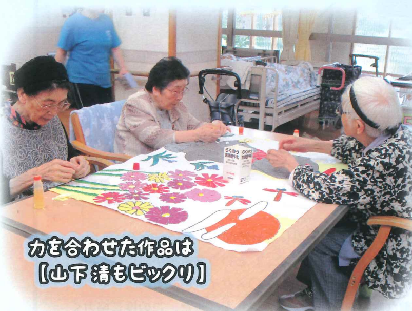
力を合わせた作品は 【山下 清もビックリ】