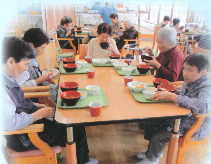
大勢で食べる昼食は「うんめー」