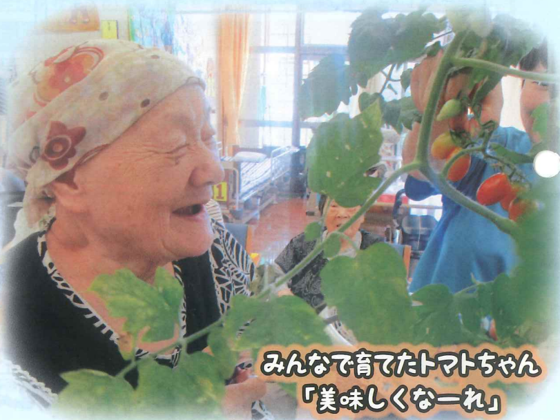
みんなで育てたトマトちゃん 「美味しくな一れ」