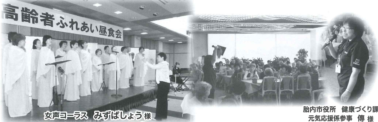
女声コーラス みずばしょう様