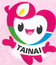
胎内市社協マスコット「こころん」

きのと小学校4年生から乙地区のお茶の間サロン(16箇所)へ プレゼントしてくれた心温まる絵手紙ポスターです。