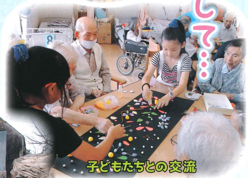
子どもたちとの交流