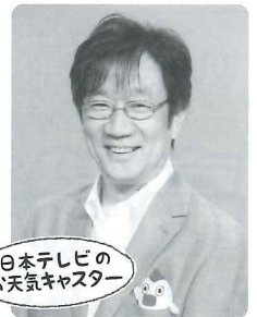
日本テレビの お天気キャスター