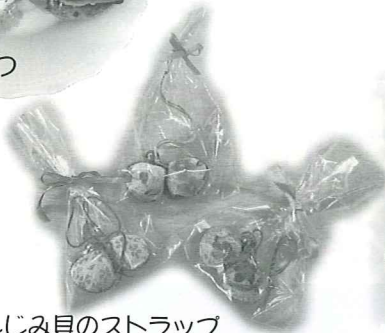
しじみ貝のストラップ