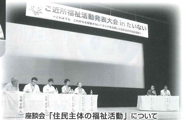
座談会「住民主体の福祉活動」について