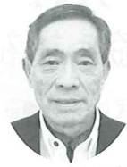
胎内市ボランティアセンター 運営委員長