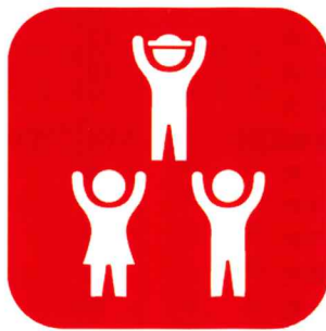
子どものための福祉事業