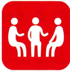
お茶の間サロン活動支援