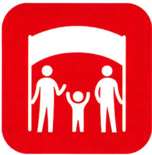
各種イベント開催