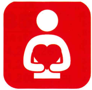
ボランティア活動、 福祉団体への支援