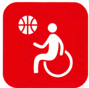
障がい者のための福祉事業