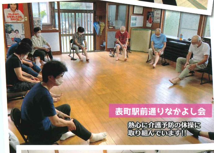
表町駅前通りなかよし会