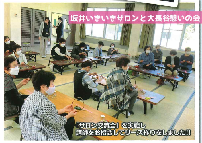
坂井いきいきサロンと大長谷憩いの会