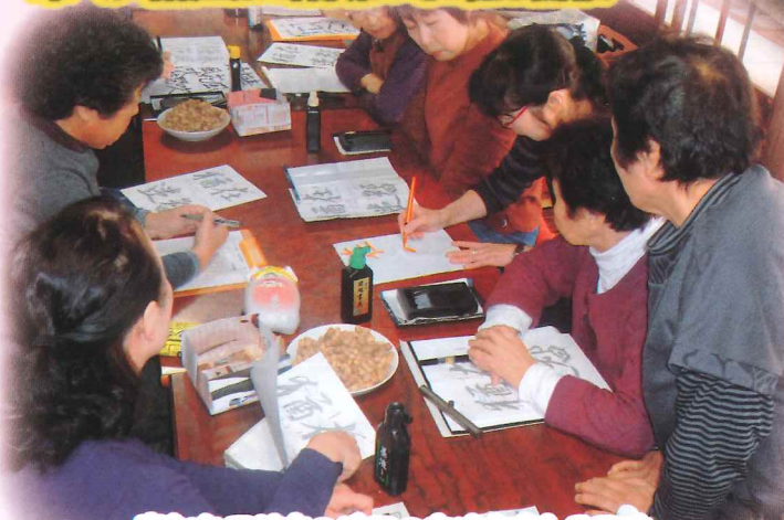
真剣な面持ちの後での交流も楽しみです。