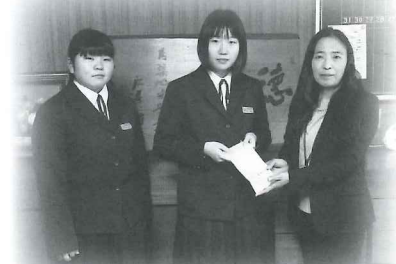
築地中学校のみなさんより