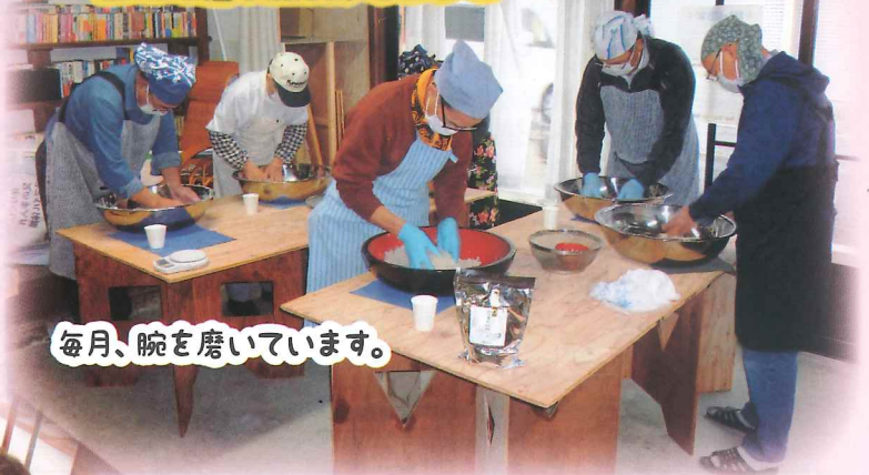
毎月、腕を磨いています。