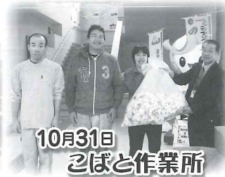
10月31日 えぼと作業所