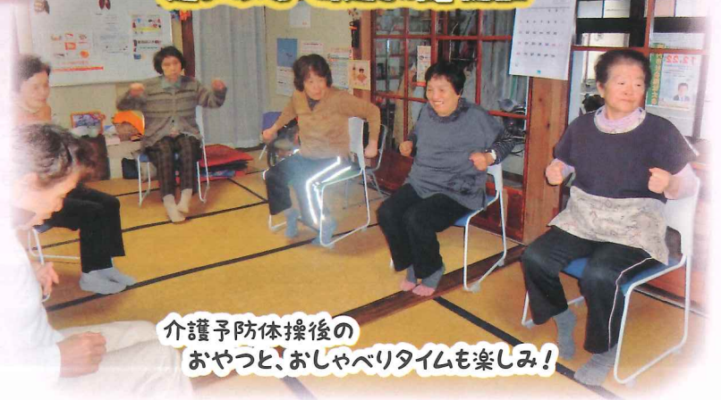
介護予防体操後の おやつと、おしゃべりタイムも楽しみ!