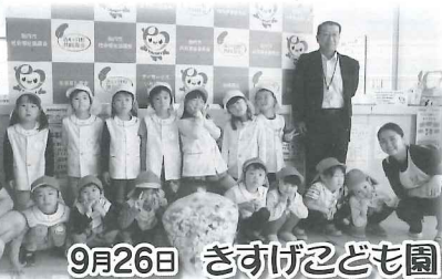
9月26日 きずげこども園