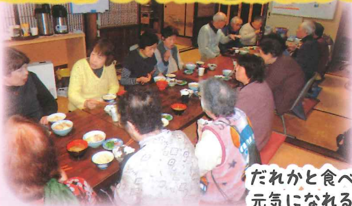
だれかと食べると 元気になるね!