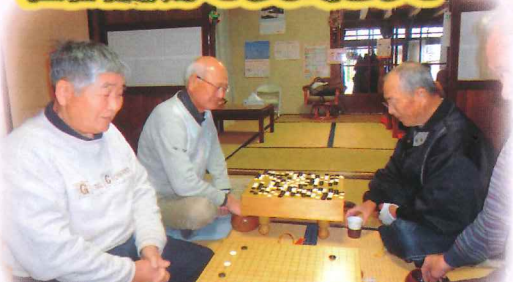
囲碁将棋が大好きな男性陣が集まって真剣勝負。 ボランティア活動も行っています。