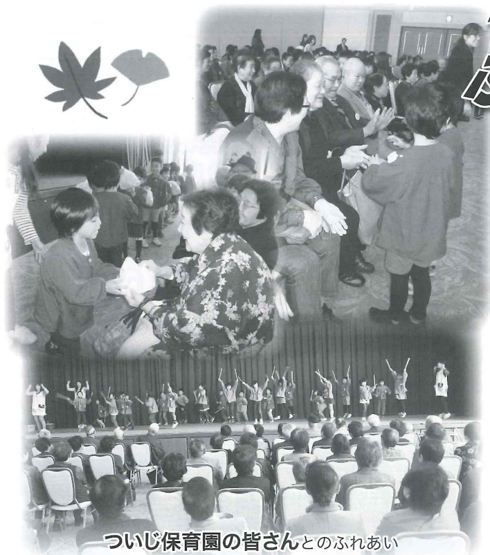
ついじ保育園の皆さんとのふれあい