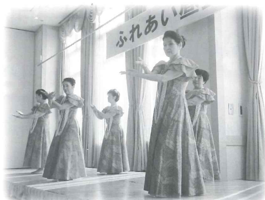
カラニハッピーフラ の皆様によるフラダンス

当日は大勢の皆様にご参加いただき誠にありがとうございました。晴天に恵まれ、園児とのふれあいや美味しいお料理と共に思い思いの会話を楽しまれ、交流を楽しんでいただくことができました。ご参加下さいました皆様の生き生きとした表情がとても印象的です。