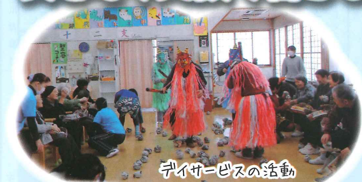
デイサービスの活動