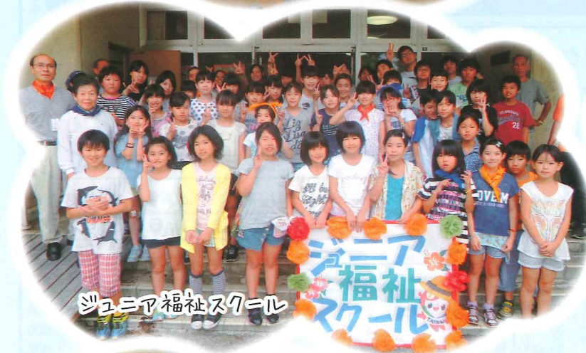
ジュニア福祉スクール