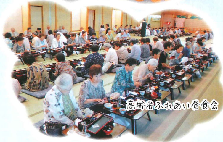
高齢者ふれあい昼食会