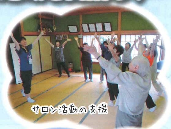
サロン活動の支援