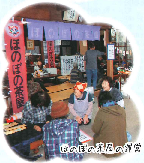
ほのぼの茶屋の運営