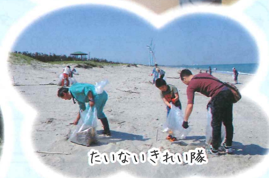
たいないきれい隊