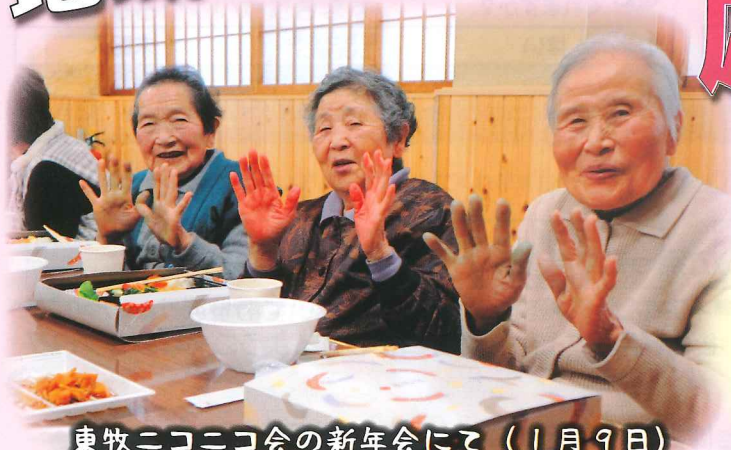
東牧ニコニコ会の新年会にて(1月9日)