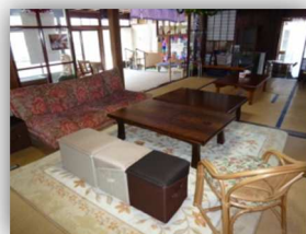
畳でもソファー、椅子を使用して立ち上がりが楽に…

ほのぼの茶屋では、安心して過ごしていただくために手すりや段差を解消する用具を設置しています。慣れないところには段差が心配で行けないという方も、ぜひ1度遊びにおいでください。