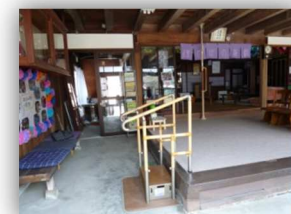
土間の段差は手すりでの出入りが楽にできます…